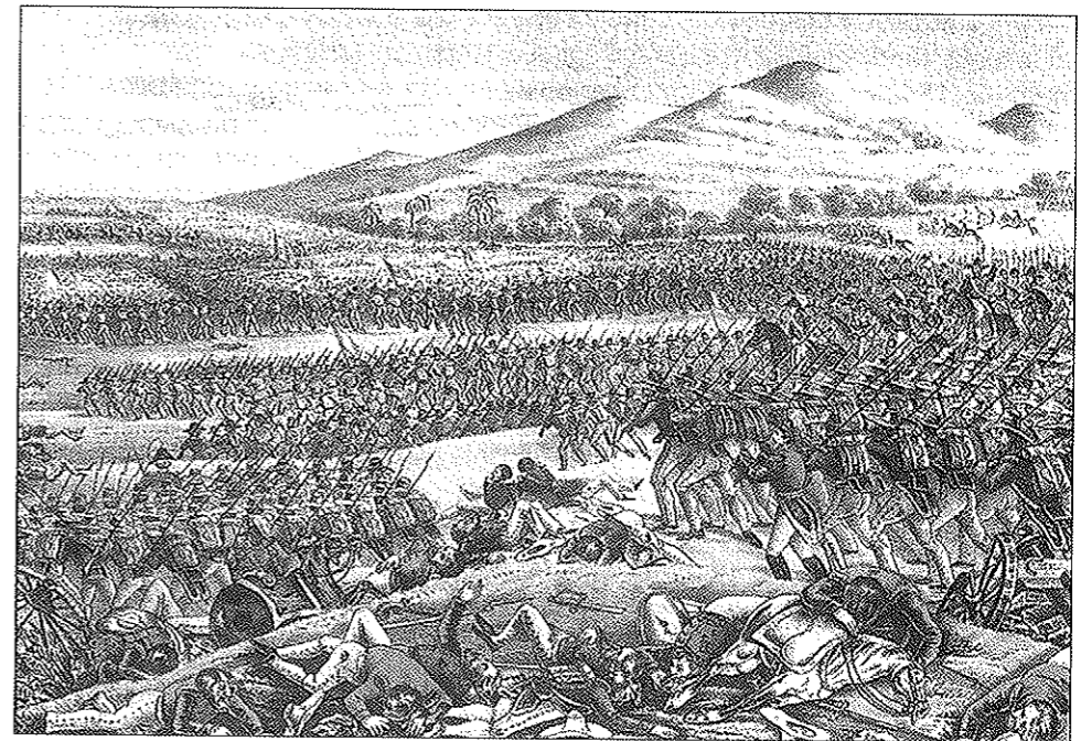
1. kép. A Buena Vista-i csata

Az amerikai kormány eredeti háborús célja a korábban kiszemelt mexikói tartományok megszerzése volt, és úgy vélte, ezek elfoglalása után, néhány fontos katonai győzelem eredményeként a mexikóiak kapitulálni fognak és teljesítik a már korábban megfogalmazott amerikai követeléseket. Erre azonban nem került sor azután sem, hogy az amerikai csapatok Új-Mexikót és Kaliforniát is ellenőrzésük alá vonták, ezért Polk elnök úgy döntött 1846 nyarán, hogy az eredményes békekötés reményében az új hadicél Mexikóváros elfoglalása. Haderőt csoportosítottak át