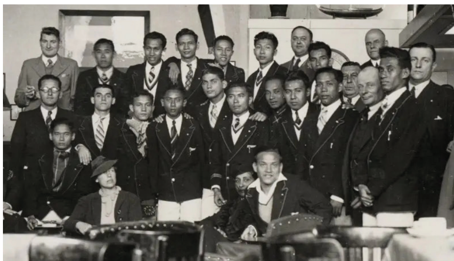
1. kép: A holland indiai válogatott.