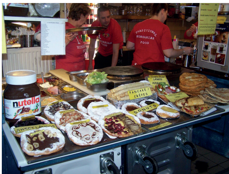
Fig. 3. Lángos with nutella and bananas - Great Market Hall Budapest.

The above-mentioned factors have jointly changed our eating habits in the past decades. In our opinion, contemporary Hungarian gastronomy cannot be precisely defined or described. We cannot state that our “most important” foods are made with grease, seasoned with paprika, thickened with roux and enriched with sour cream as before. We are currently living in a transitional era.