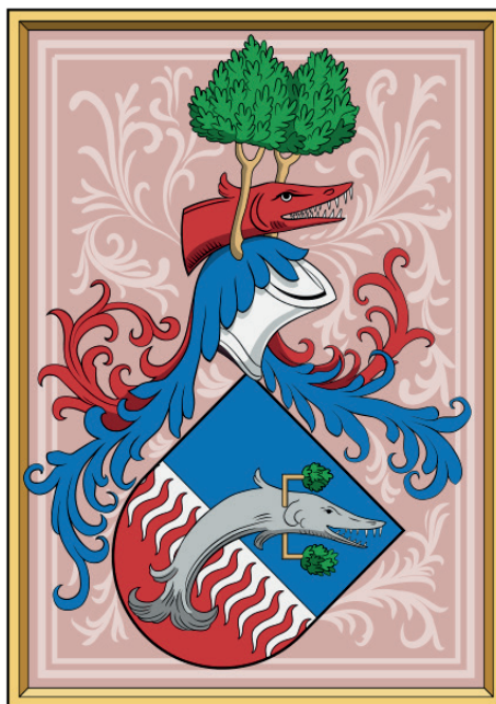
Fig. 1. Eresztvényi family coat of arms. 16

According to his chronicler, Gáspár Heltai, king Matthias Corvinus liked mostly the Saxon cabbage with bacon. 17 Galeotto Marzio informs us that our ancestors ate beside square tables and served all dishes in sauce. Sauces were differentiated based on the main features and ingredients of dishes. Young pheasant, partridge, duck, capon, goose and starling, various food prepared from lamb, calf, kid, pork, boar and different fish were served in their own special sauce enriched with unique spices. It was also customary that our ancestors to eat from a shared bowl. Nobody used forks to take a piece of food or to lift it to their mouths. Everybody had their own bread on the table in front of them, took the meal from the bowl, slicing it with their knives if it was not already sliced and they ate with their hands. In Matthias' courtyard, saffron, clove, cinnamon, pepper and ginger were the most popular spices. Galeotto considered the Hungarians as people with more vigorous and more impulsive nature,