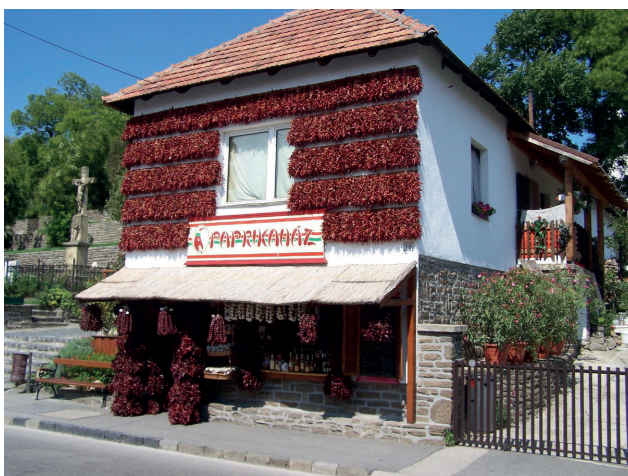
Fig 2. Paprika house in Tihany.